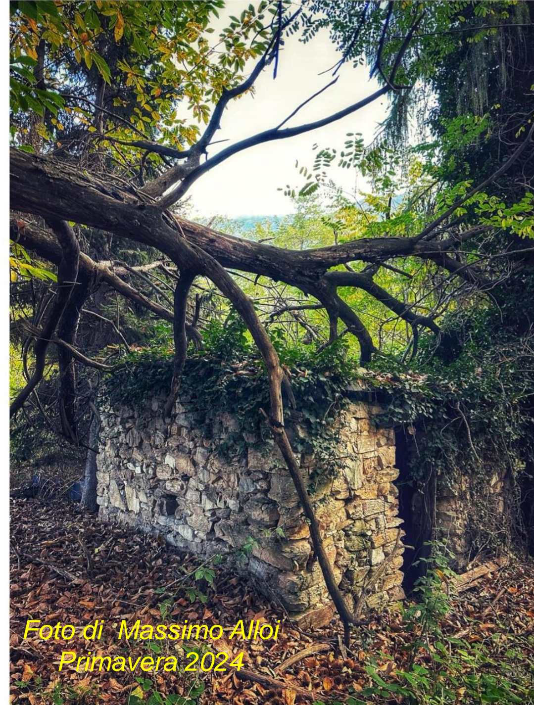
Primavera 2024

“Mi aggiro per le strade ... il paese sembra assediato dalla natura, che preme da tutti i lati, penetra tra le case, si appropriava dei ruderi, dei sentieri, dei terrazzamenti un tempo coltivati. Mi sorprende come il bosco riesca ad avanzare così velocemente, inesorabile, di stagione in stagione. ”