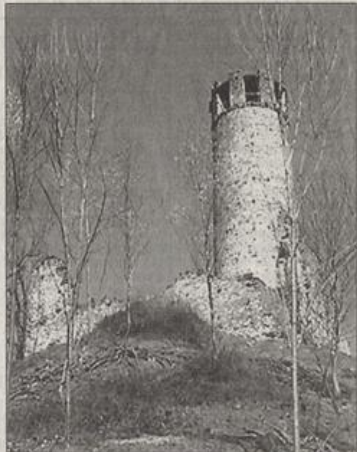
BRONDELLO - La torre ripulita