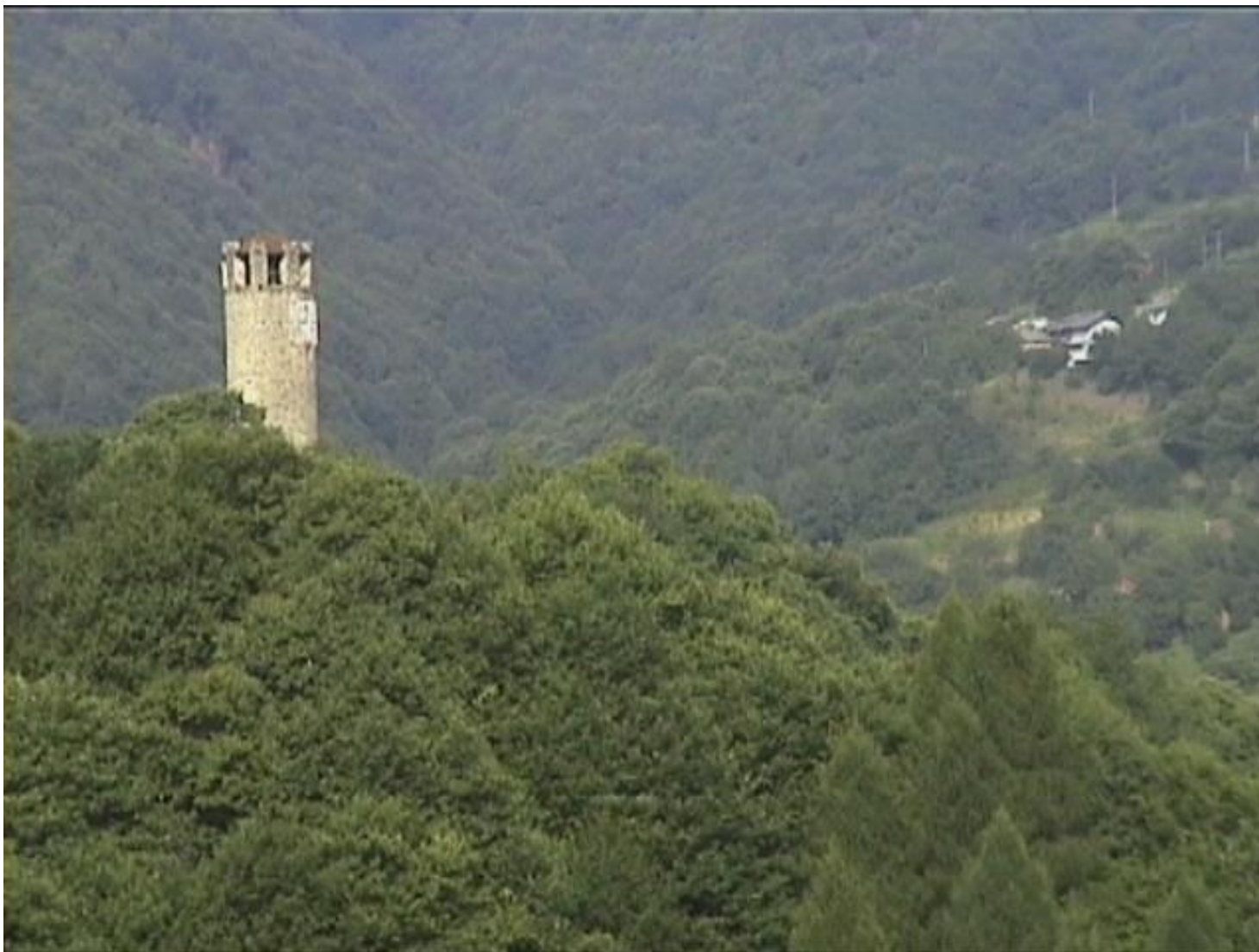
Torre Medioevale vista da Borgata Frera, sopra a Fraz. Rossi salendo per San Bernardo il vecchio.