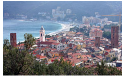
Panorama di Noli