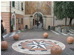
Porta di Piazza