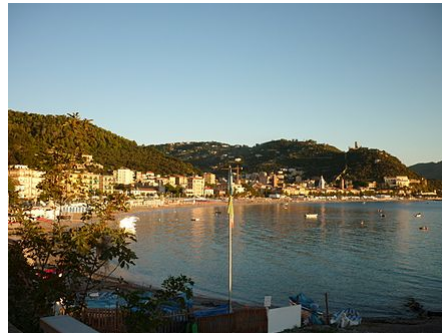
Veduta di Noli

L'atto di nascita della repubblica marinara fu sottoscritto il 7 agosto 1192 nella chiesa di San Paragorio . [4] Fu allora che Enrico II vendette al comune di Noli il castello di Segno ed altri diritti signorili [5] .