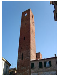
Una torre di Noli