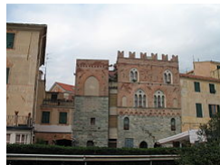
Antichi palazzi signorili