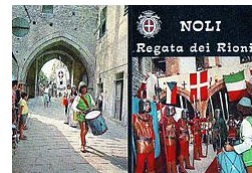
Rievocazione storica della repubblica