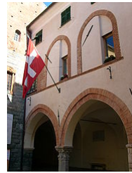
Il palazzo del governo, ora comunale