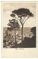
Noli nel 1941