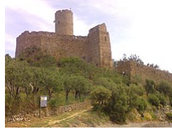
Il castello di Monte Ursino